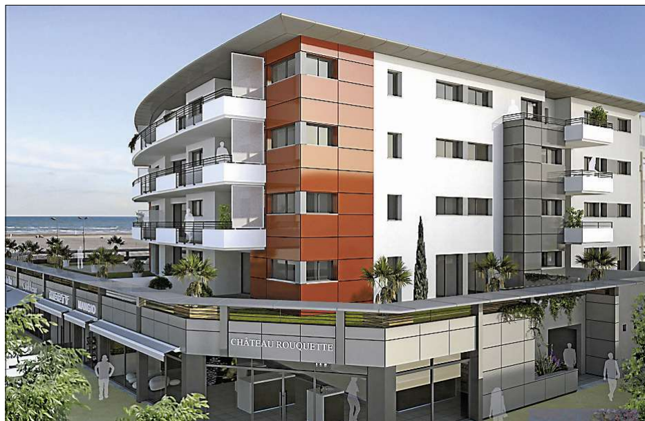
■ L'architecture dessinée par Guy Vitrou rappelle la proue d'un navire, face à la mer.

Mais l'investissement ne semble pas effrayer les acheteurs. Huit des 22 logements disponibles sont déjà réservés alors que la commercialisation n'est pas officiellement lancée. Il faut dire qu'un soin particulier a été apporté aux prestations: climatisation réversible, haute performance énergétique, grandes ouvertures, vastes terrasses, déco personnalisable... Au rez-de-chaussée, des cellules accueilleront plusieurs commerces (épicerie fine, glacier...), une agence bancaire et, sur 200 m 2 , un restaurant. « Ce ne sera pas forcément un gastronomique, mais un opérateur très qualitatif. Deux sont en lice. Mais les candidats peuvent encore se déclarer. Le choix définitif se fera en concertation avec la municipalité », précise le promoteur François Boscary. Et d'espérer que son