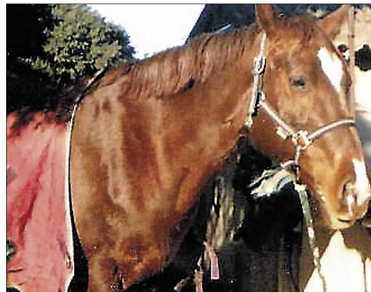
■ Le sort de la jument devrait se jouer aujourd'hui.